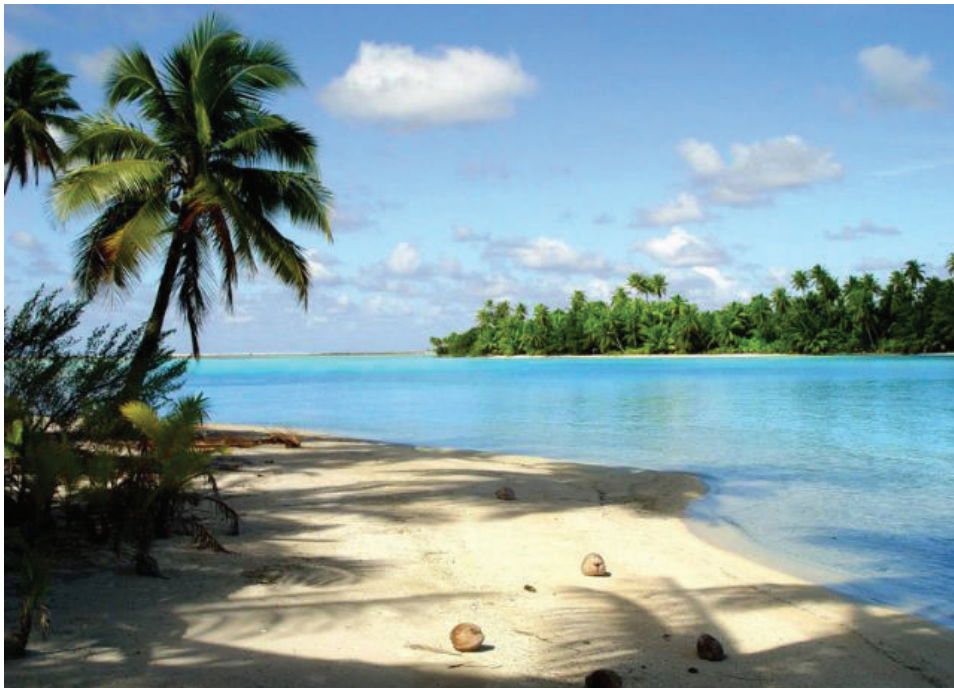
Gambar 3.1

16 Maka Allah menjadikan kedua benda penerang yang besar itu, yakni yang lebih besar untuk menguasai siang dan yang lebih kecil untuk menguasai malam, dan menjadikan juga bintang-bintang.